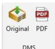
Add-in Icons in MS Word

Das neue, lizenzpflichtige Office Add-in löst das bisherige lizenzpflichtige, signierte Office Makro ab.